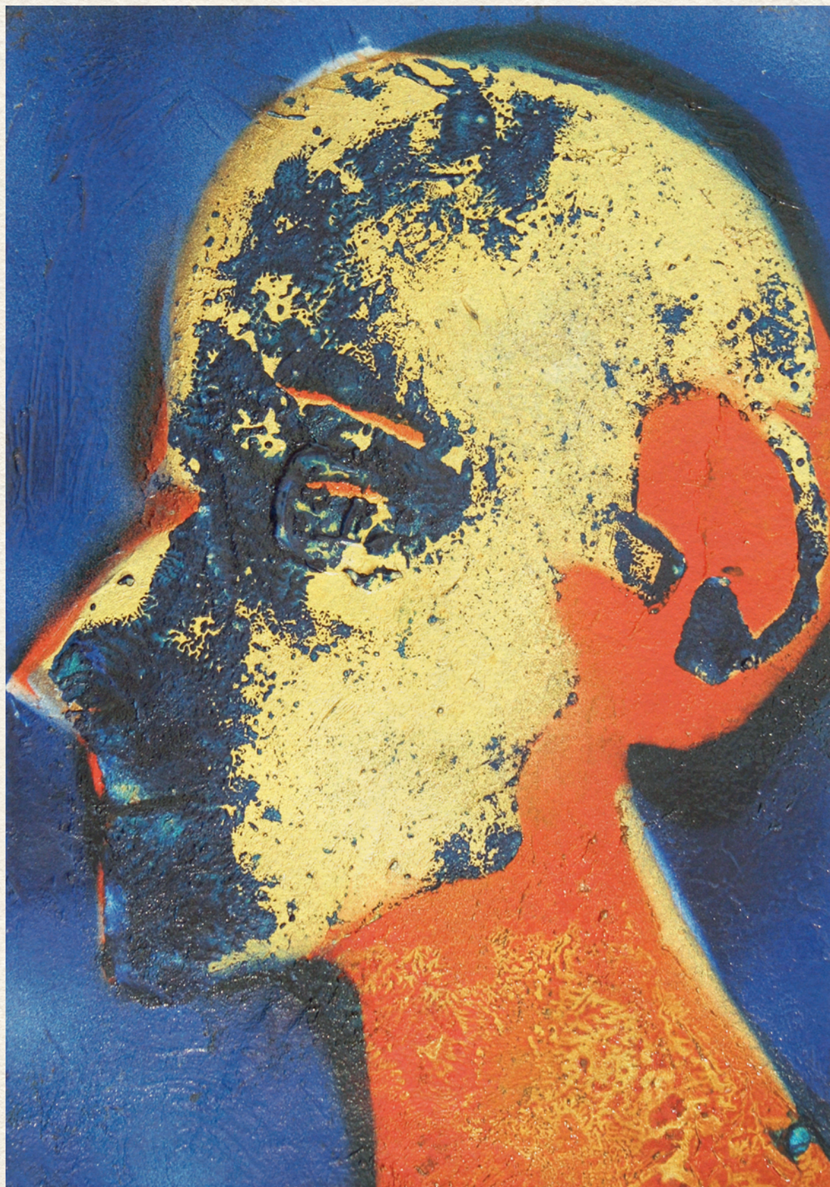
ESZTER FIA ALI - 1996., papír, vegyes technika, 30x21 cm