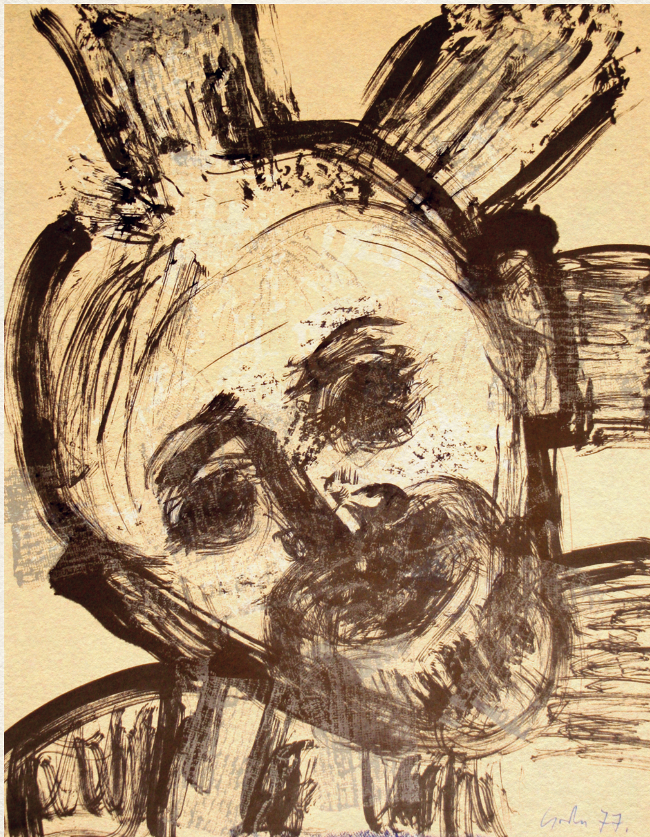
ÖNARCKÉP - 1977., papír, vegyes technika, 65,5x51 cm