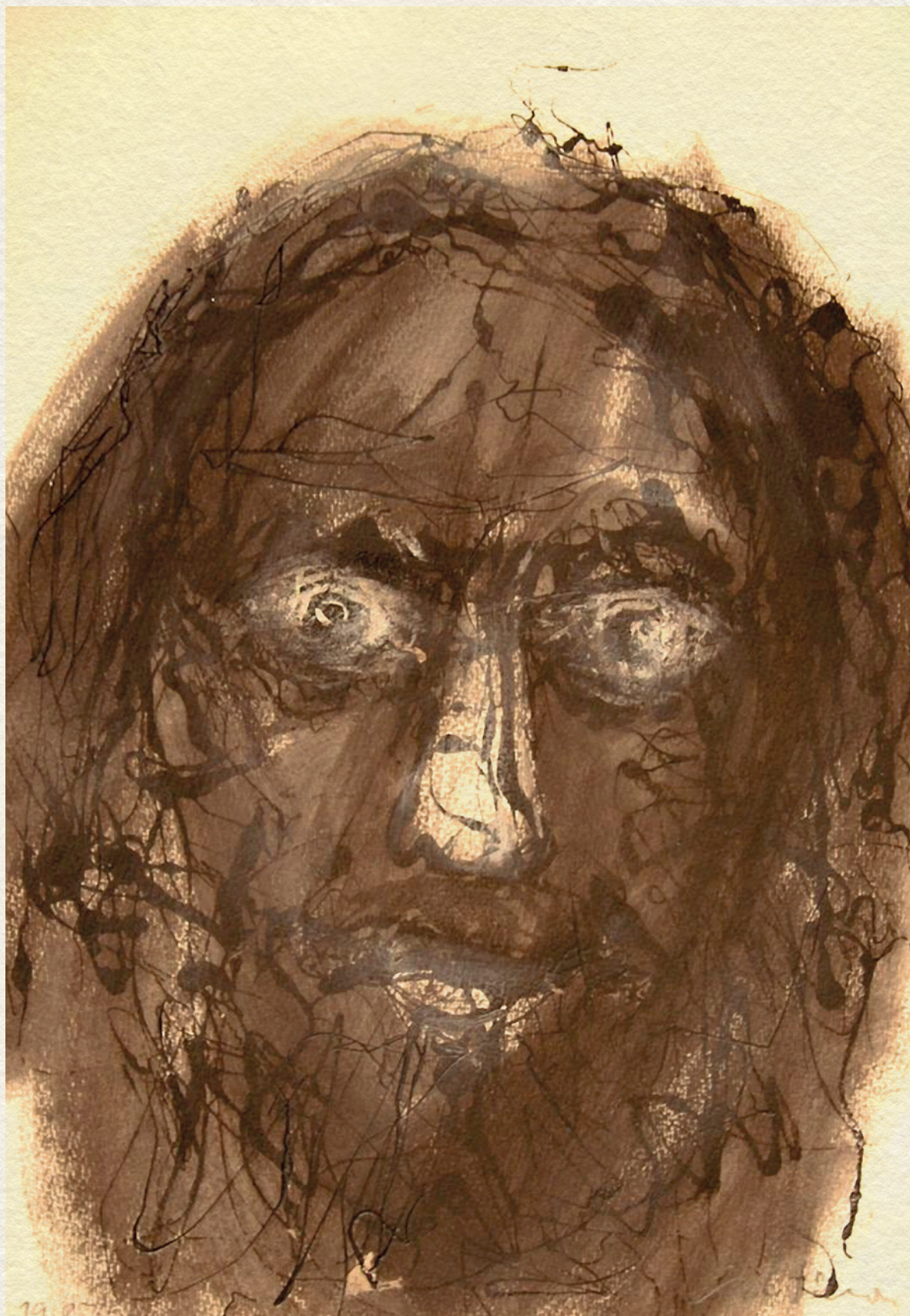
ÖNARCKÉP - 1987., papír, 50x35 cm