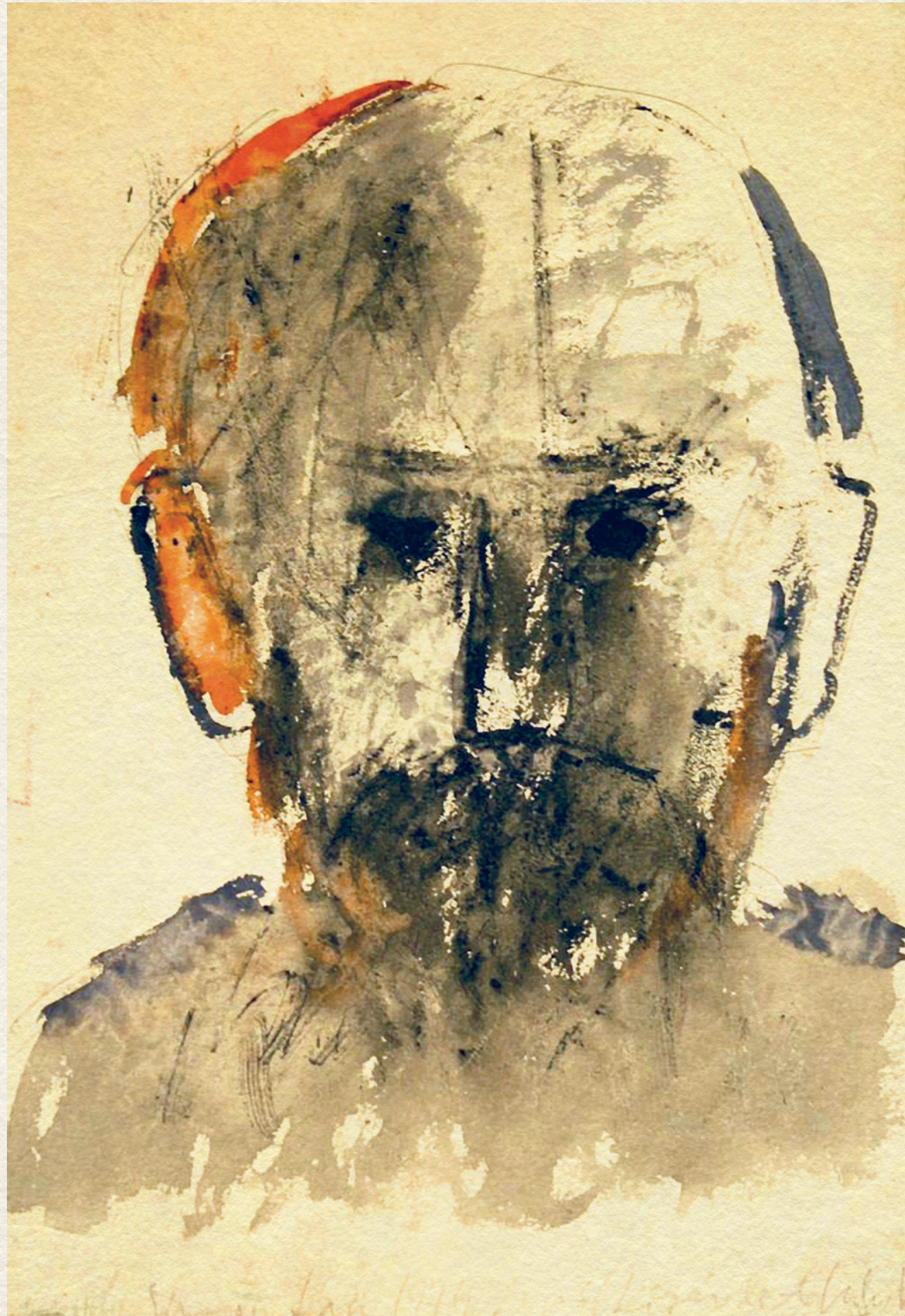
LIPÓT KÍSÉRLET - 1974., papír, 30x21,5 cm