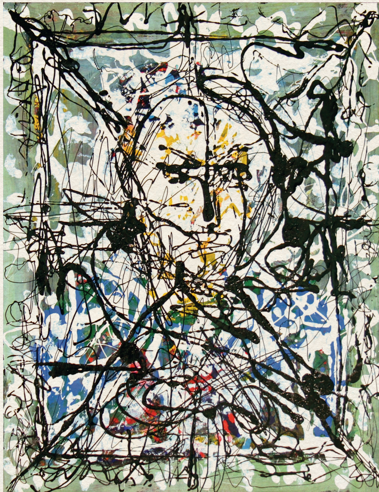
BIELE FELD II. - 2001., papír, csurgatott, 64,5x50 cm