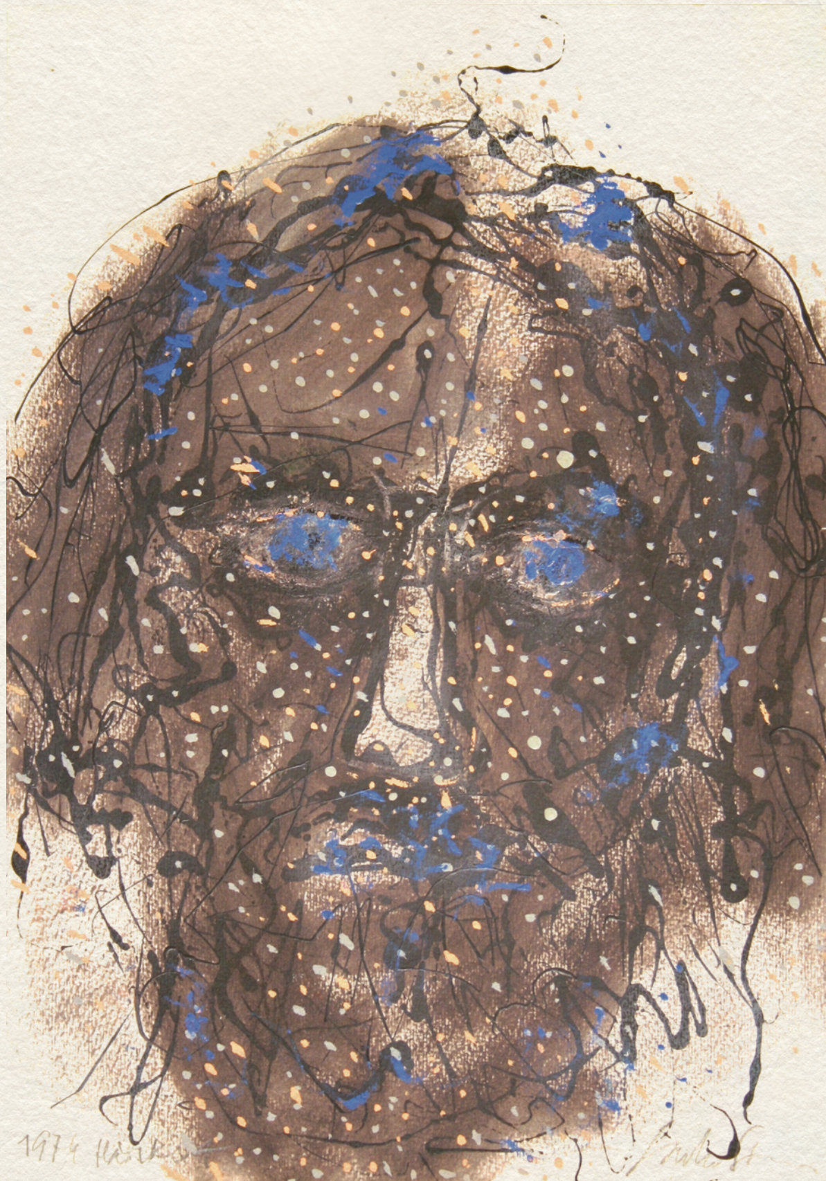
HÁRSKÚT (MÉHPÁSZTOR-SOROZAT) - 1974., papír, vegyes technika, 50x35 cm