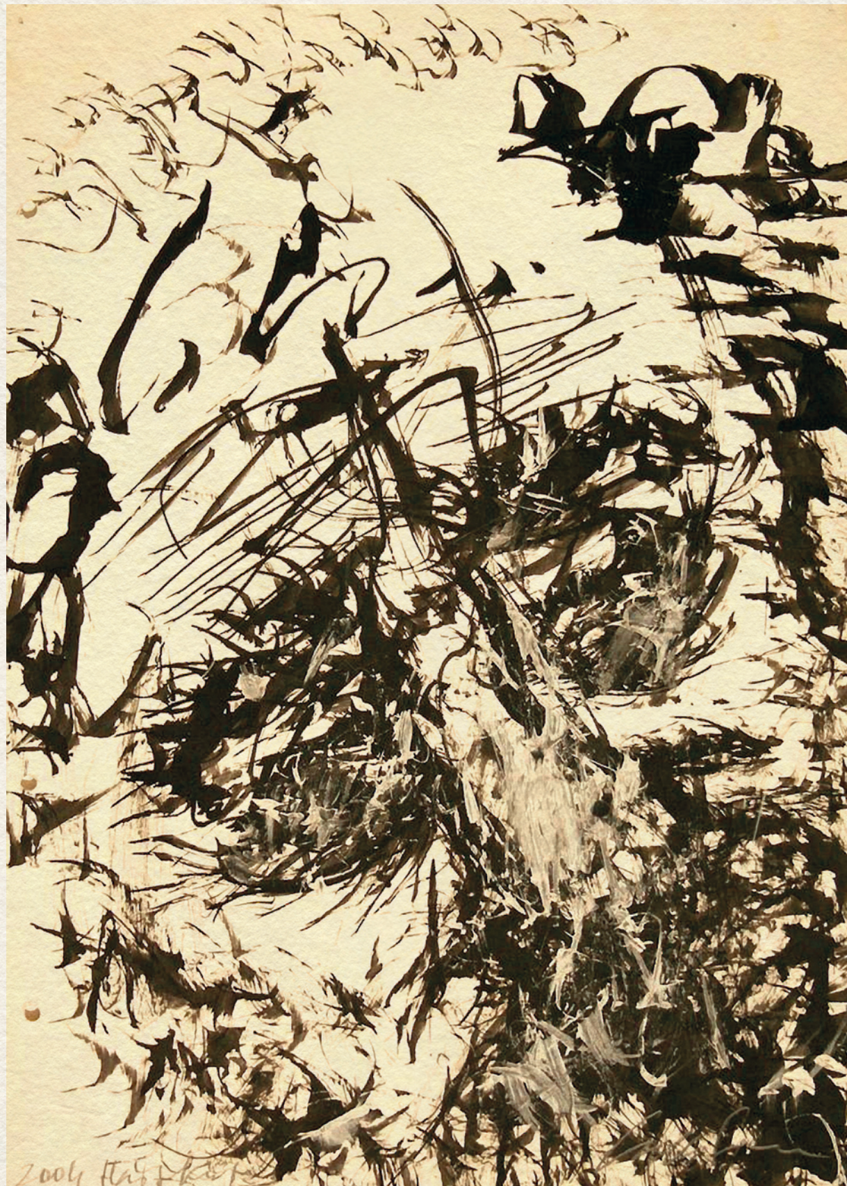
HÁRSKÚT II., ÖNARCKÉP - 2004., papír, vegyes technika, 43x31 cm