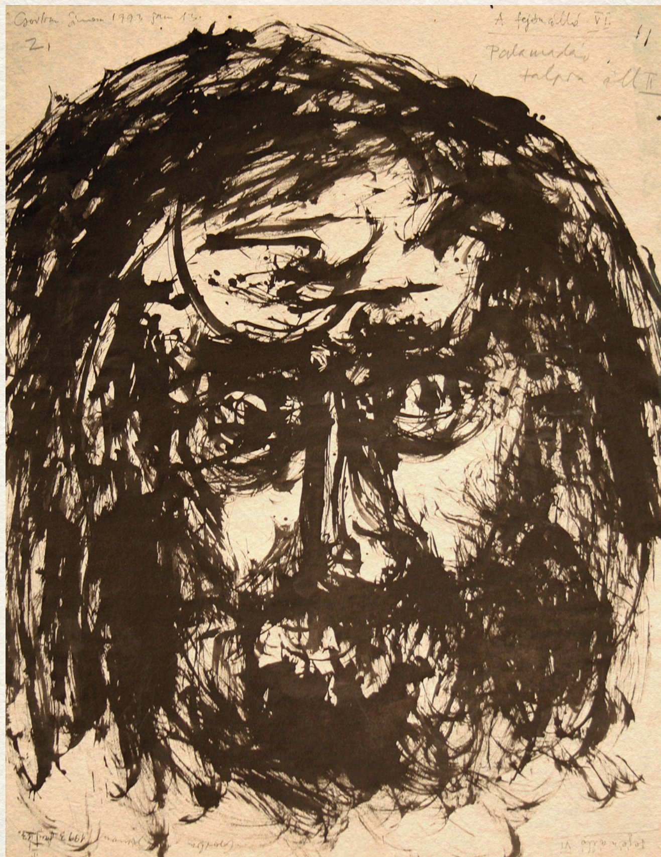
A FEJÉNÁLLÓ VI. - 1993., papír, akvatinta, 65x51 cm