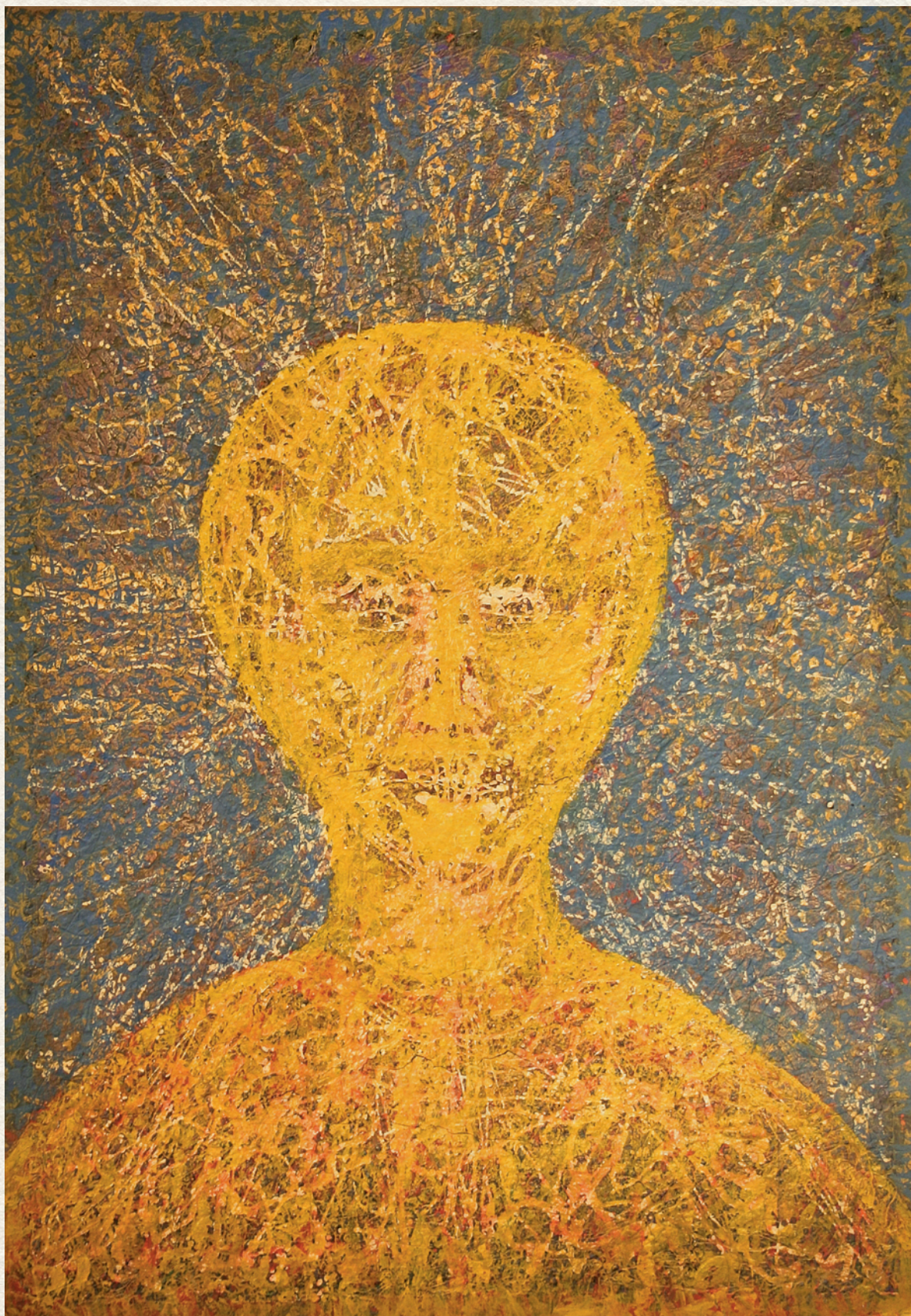
MASZK NÉLKÜL ARC-HARC XXXIV. - 1995., karton, vegyes technika, 100x70 cm