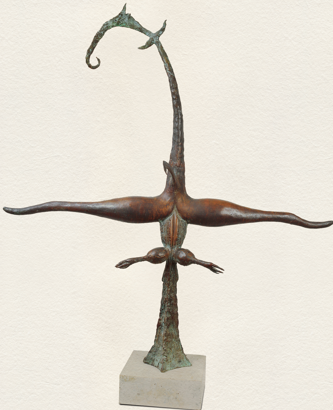
EMESE ÁLMA – 1996., bronz, dombormű, 133 x114x26 cm