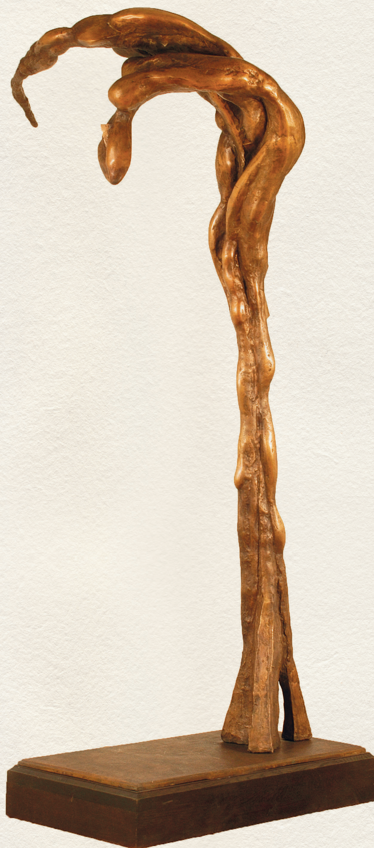
KÉT ŐS – 2001., bronz, dombormű, 202x50x91 cm