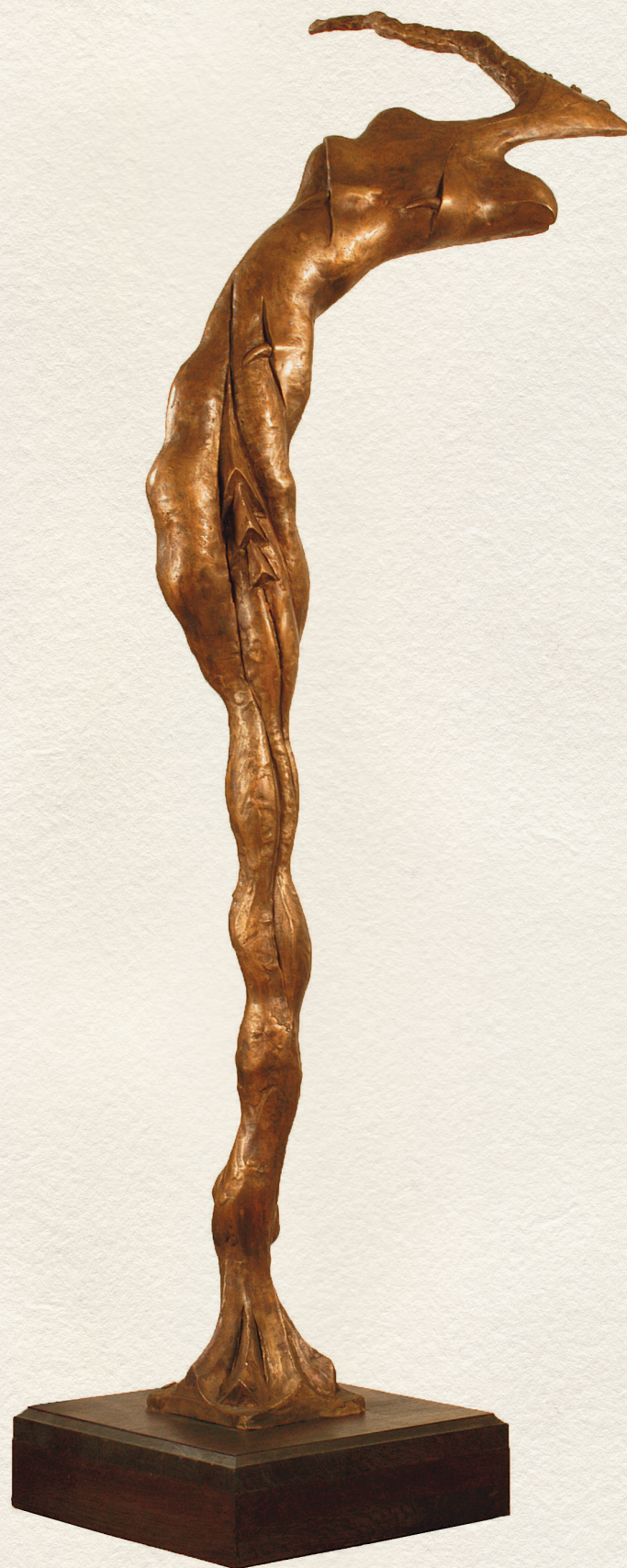
HOLDFÉNYBEN FÜRDŐ – 2001., bronz, 190x62x60 cm