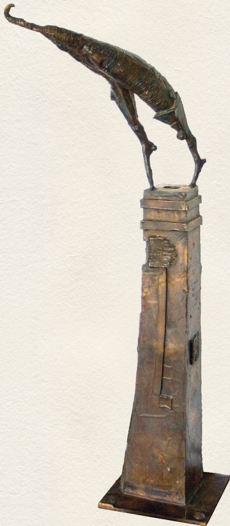
PANEL ÁLOM – 2006., bronz, viaszveszejtékes eljárás, 84x19x19 cm