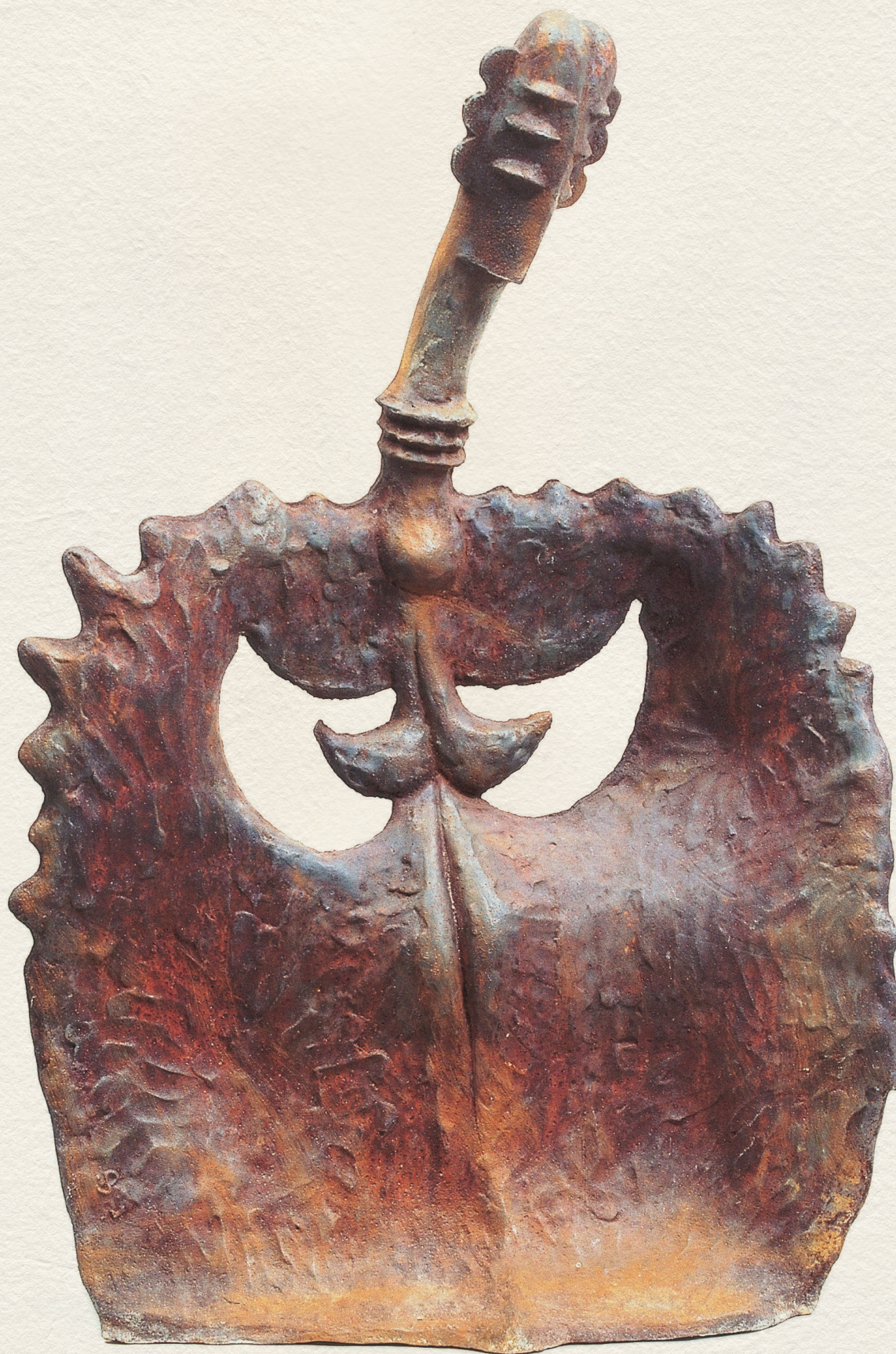
VÉNUSZ – 1986., öntöttvas, dombormű, 76 cm