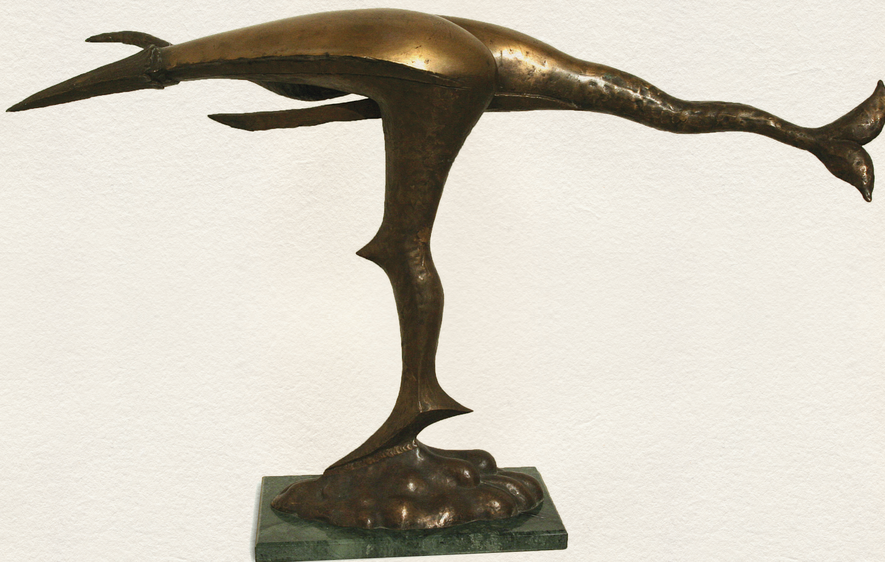
CÍM NÉLKÜL – 1995., bronz, 74x127x41 cm