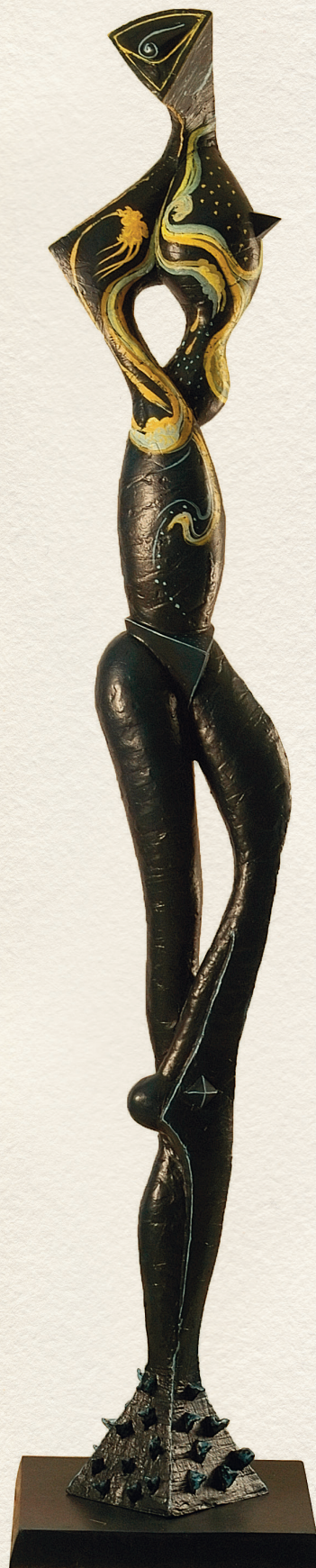
BEFELÉ NÉZŐ – 2003., bronz, festett, 206x42x42 cm