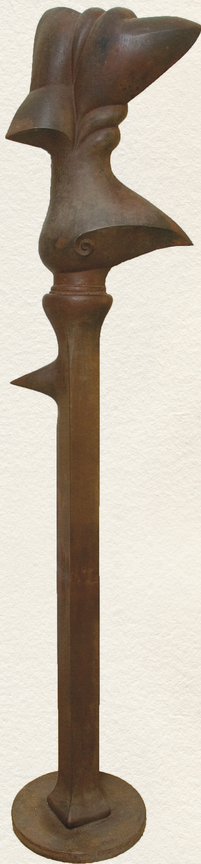
ŐROSZLOP I. – 1985., öntöttvas, 240 cm