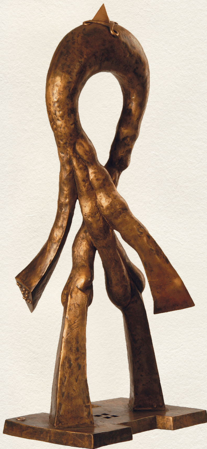
JÓJEL – 2002., bronz, dombormű, 40x22x86 cm