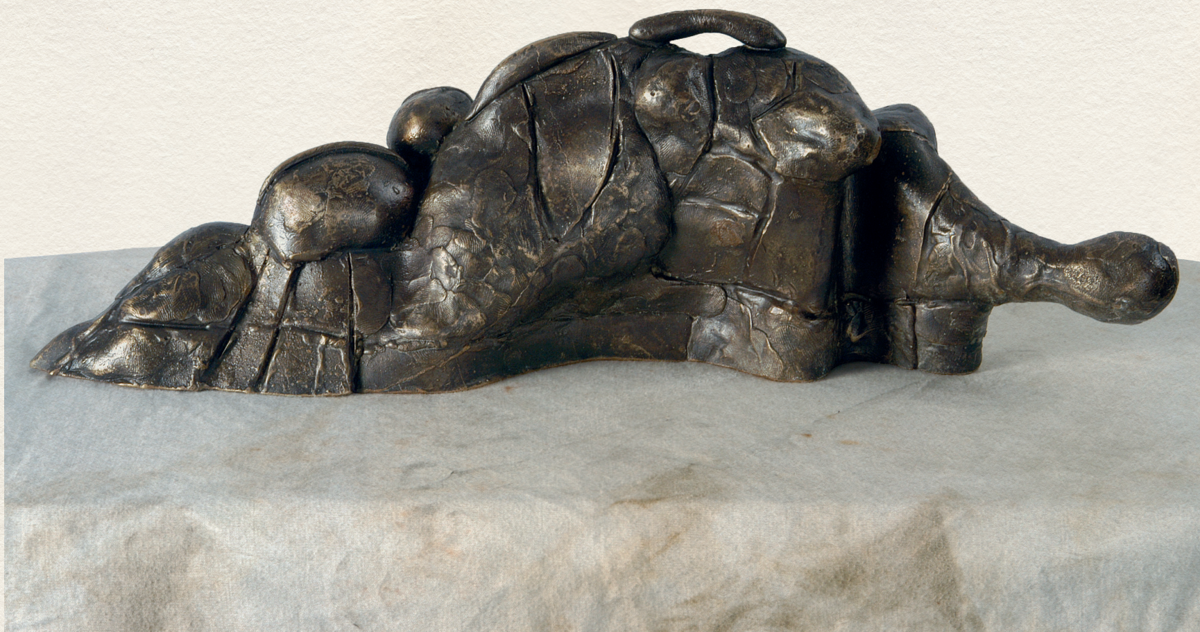
ÉLRAGADTATOTT I. – 2003., bronz, dombormű, 8x31x16 cm