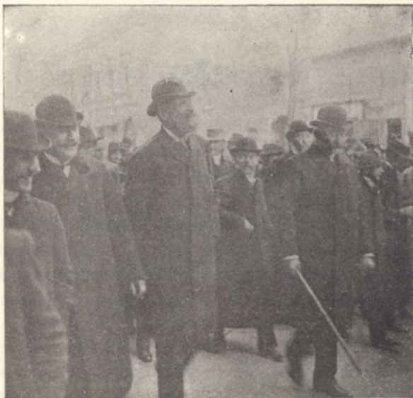
(„A ki mindenütt ott van.”)