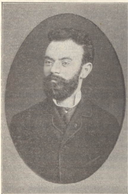
(Budai Elek arczképe 1879-ben.)

Az önzellen, nemes lelket, bár a szerénység leple takarja, mindenki fölismeri.