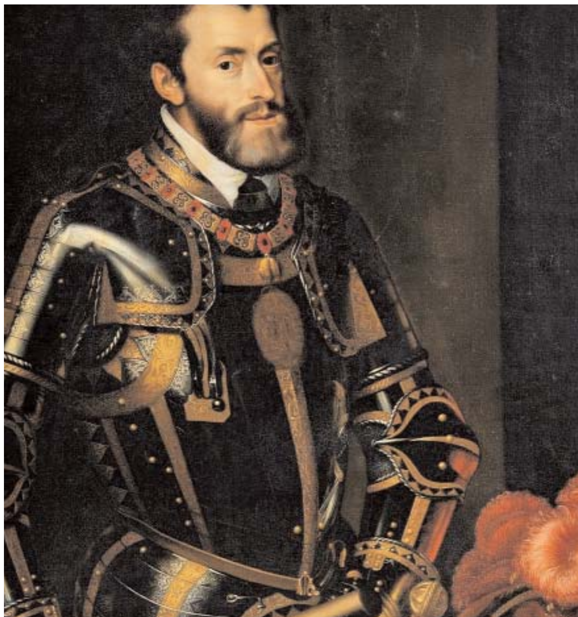
V. Károly császár