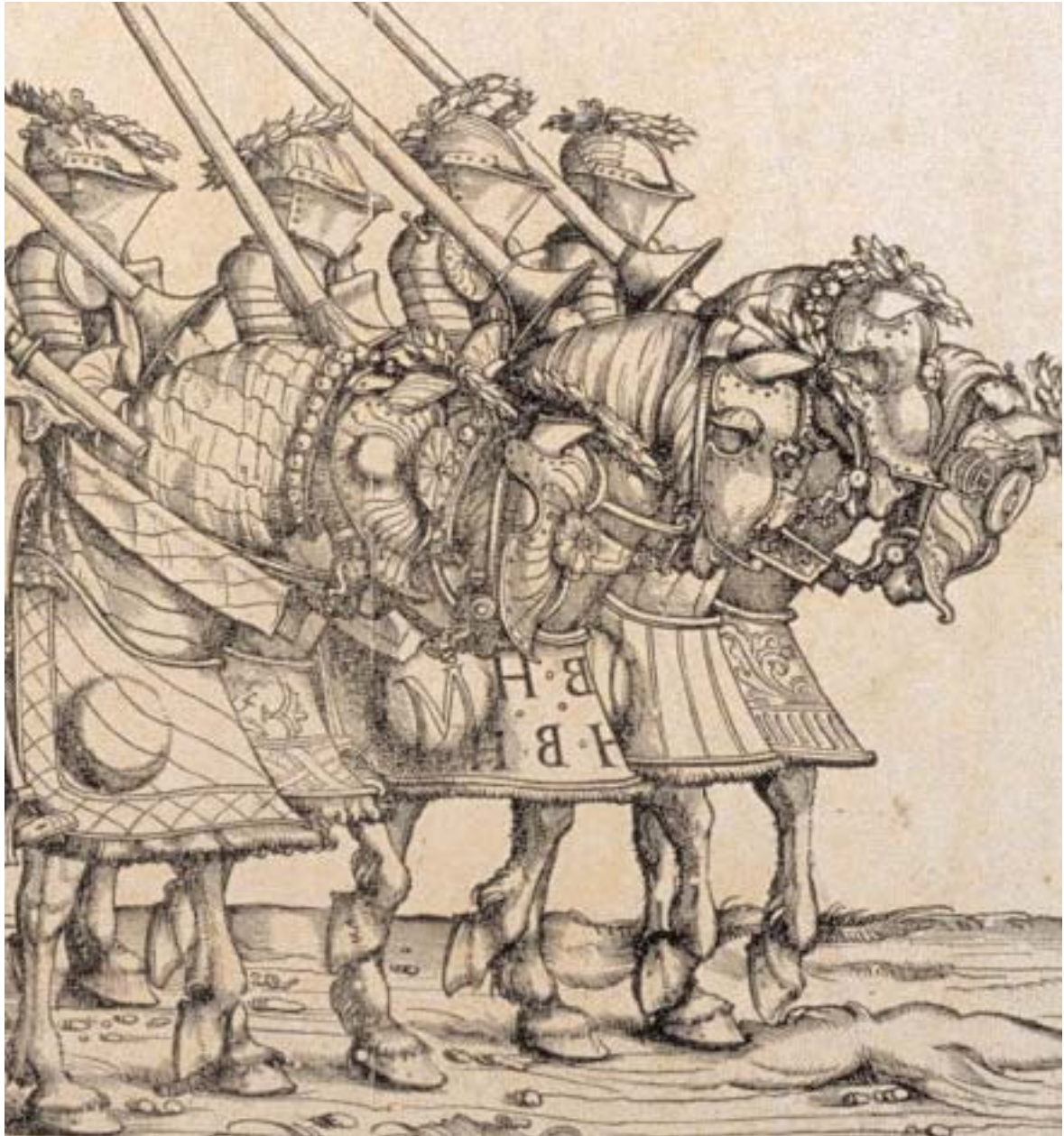
Miksa császár lovagjai a diadalmeneten